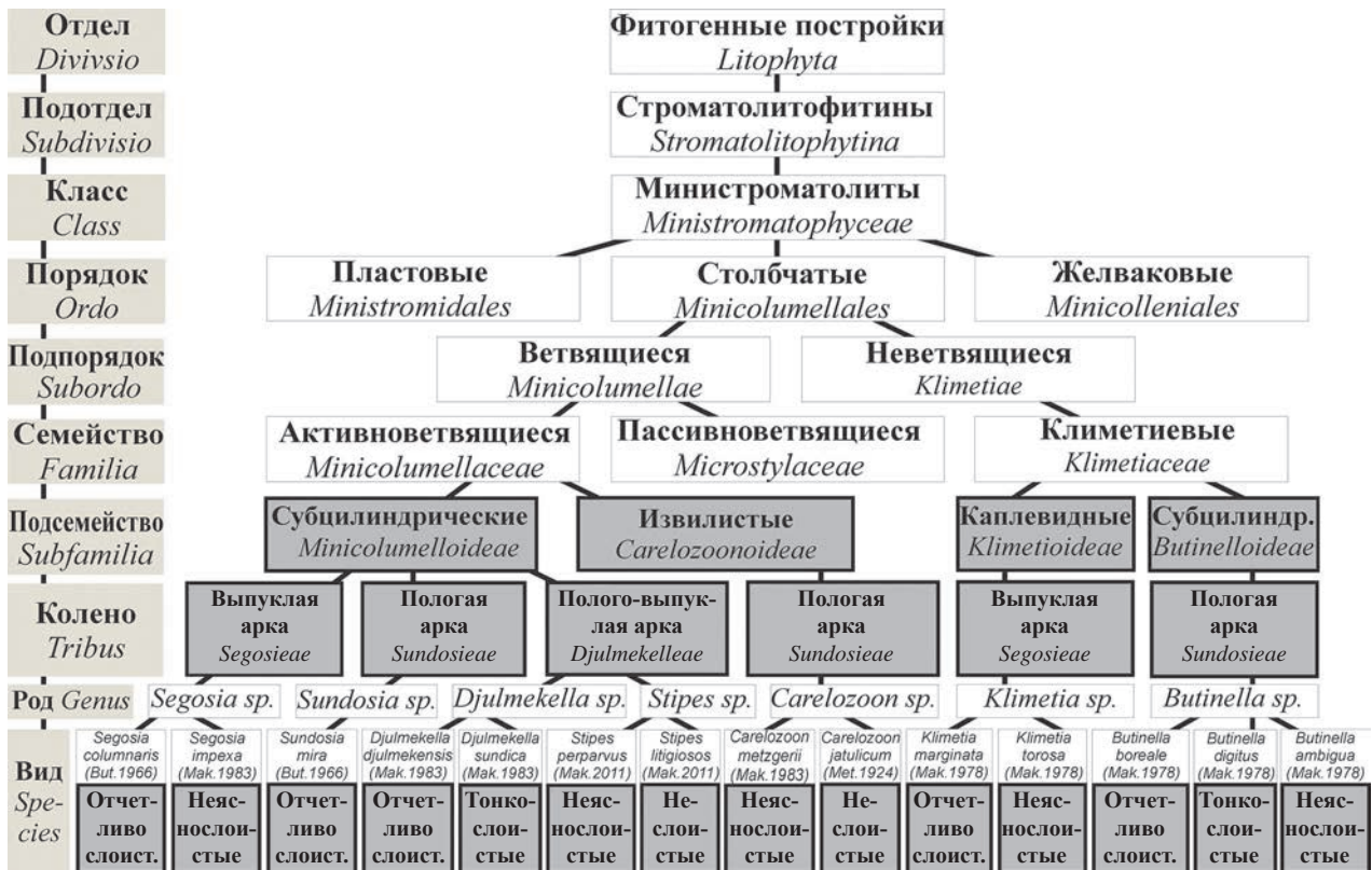
Рис. 1. Уточненная классификационная схема класса Ministromatophyceae (министроматолиты). Темным выделены уточнения