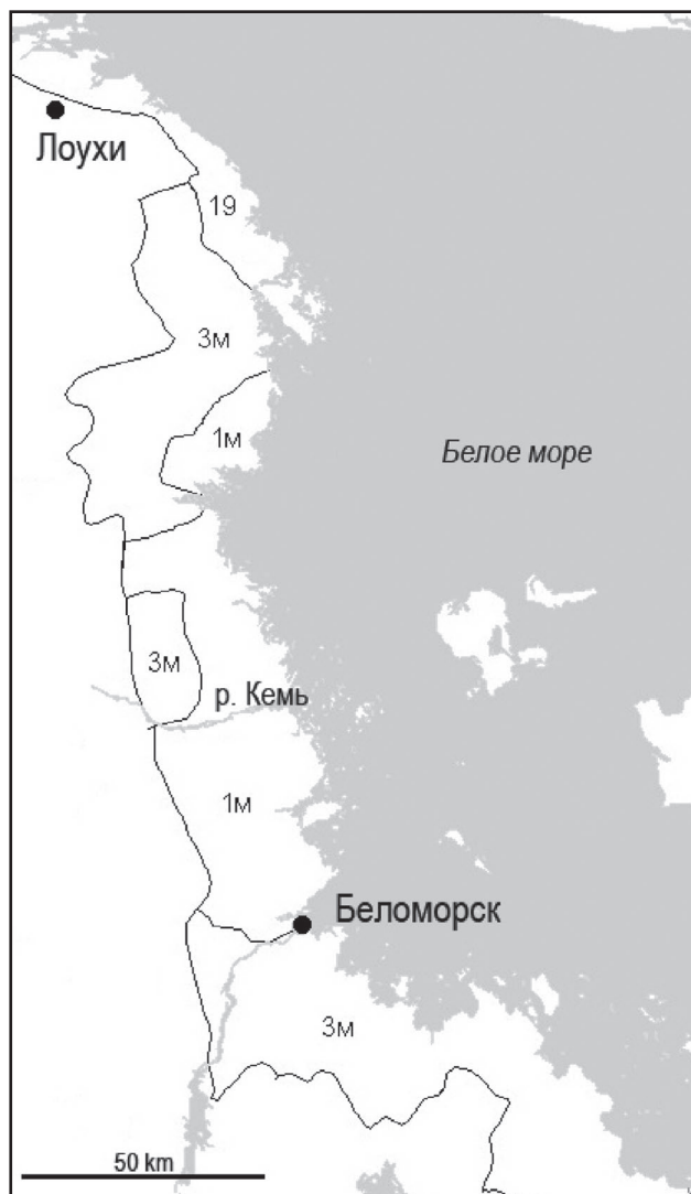
Рис. 1. Карта-схема типов географического ландшафта на Карельском и Поморском берегах Белого моря.

Типы ландшафта: 1м – озерные и морские сильнозаболоченные равнины с преобладанием еловых местообитаний, 3м – озерные и морские сильнозаболоченные равнины с преобладанием сосновых местообитаний, 19 – скальные среднезаболоченные с преобладанием сосновых местообитаний