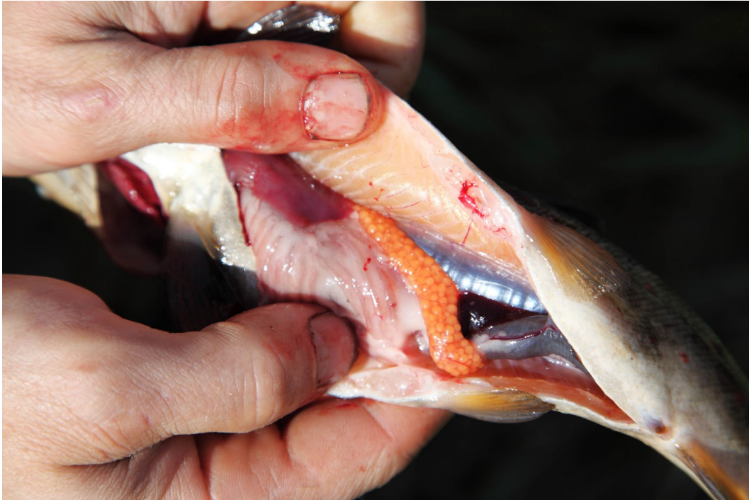
Рис. 4. Карликовая самка, отловленная в ручье Лопатка (III стадия зрелости)