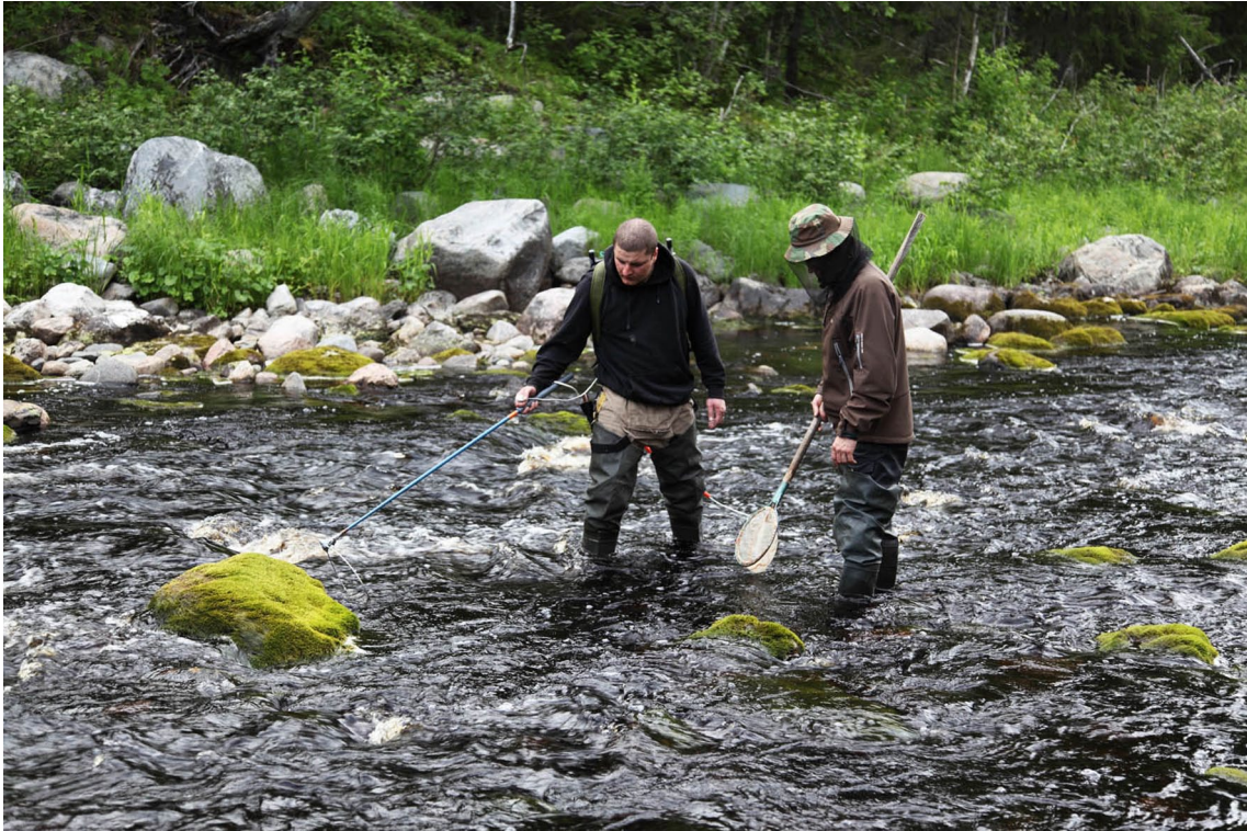
Рис. 2. Облов электроловом участка ручья Лопатка, расположенного на удалении 1,2 км от устья Fig. 2. Complete sampling of fish with the use of electrofishing equipment at the site of the Lopatka stream located over a distance of 1,2 km from its mouth

валуна (5,1–25,0 см) – 45–70 %, а также небольшого количества песка (0,5–2,5 мм) – менее 5 %, что свидетельствует о наличии пригодных площадей для естественного нереста. Выростные участки представлены галечно-валунным грунтом, редко встречаются глыбы (свыше 70 см).