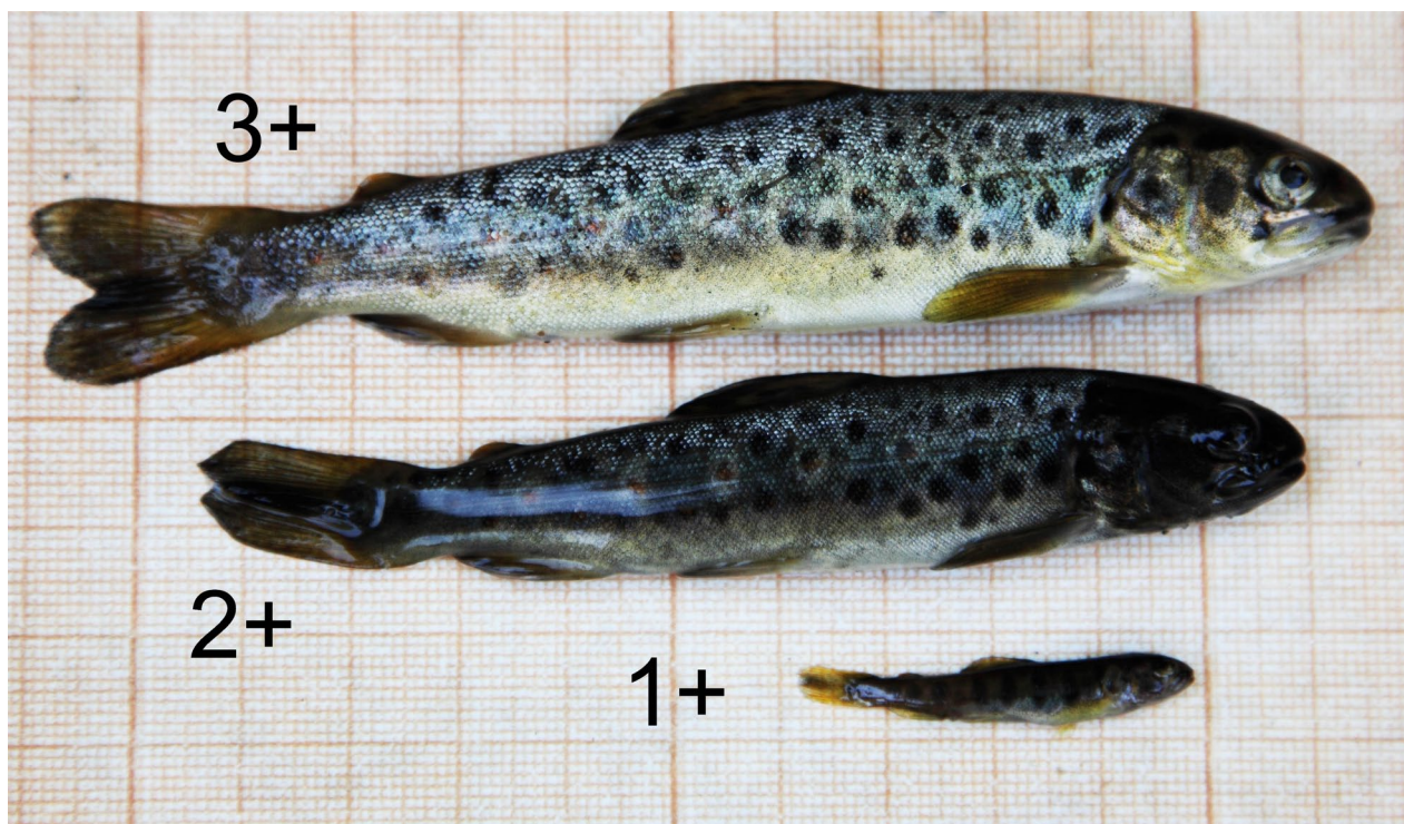
Рис. 3. Молодь кумжи трех возрастных групп из ручья Лопатка