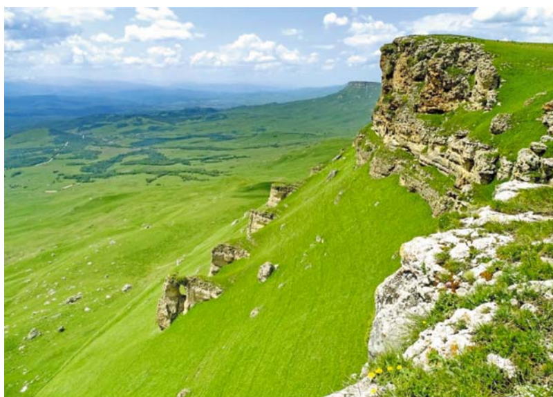
Рис. 2. Южный край массива Больше, вдали – массив Баранаха, слева – Северо-Юрская депрессия