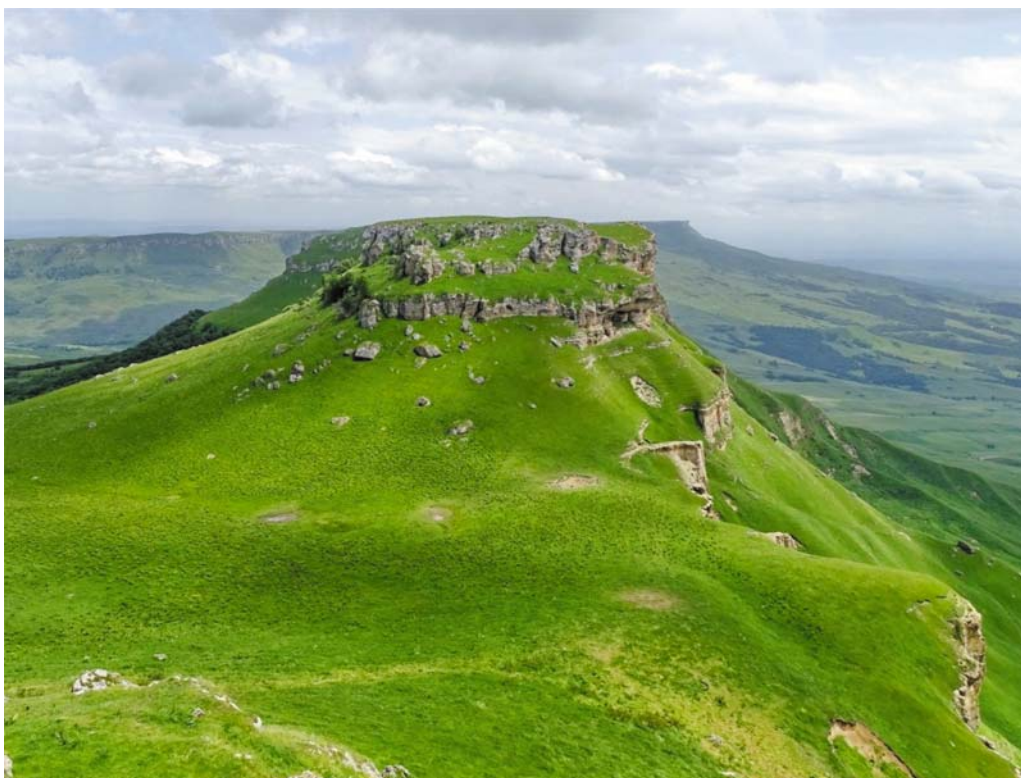
Рис. 5. Седловинная поверхность в восточной части массива Баранаха со следами вытаптывания вблизи водопоев. Вдали – массив Больше