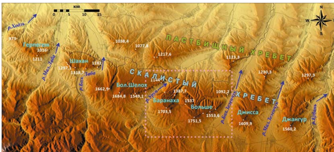
Рис. 1. Схема орографического строения западной части Скалистого хребта с указанием границ исследуемого района