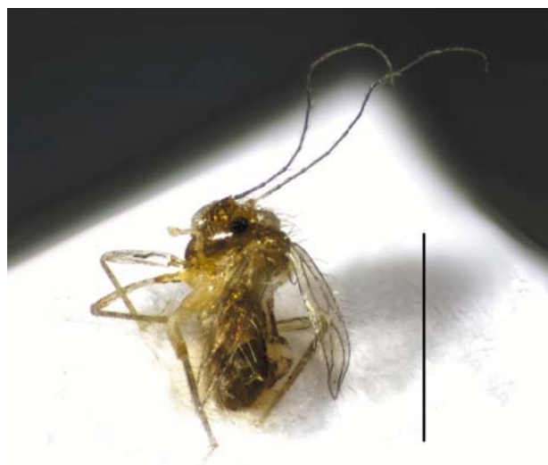
Рис. 2 / Fig. 2. Dorypteryx domestica . Масштаб 1 мм / Scale bar 1 mm

Материал: Kol : Петрозаводск, 2.10.1994 (А. Хумала), 11.09.2022 (А. Попова).