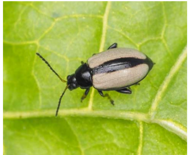
Рис. 15 / Fig. 15. Phyllotreta armoraciae

Широко распространенный голарктический вид. На европейской части России встречается от таежной до степной зоны [Жесткокрылые..., 2019]. В Карелии пока известен из единственной локации, где, судя по датам находок, возможно, существует стабильная популяция.