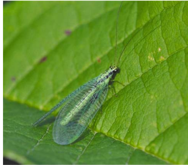
Рис. 18 / Fig. 18. Chrysopa walkeri

Материал: Kol : заказник «Кижский», о. Бол. Клименецкий, Грызनावолок, 2.07.2019, 4.07.2019 (А. Хумала); Kol : Петрозаводск, 6.07.2023 [ https://www.inaturalist.org/observations/171627552 ].