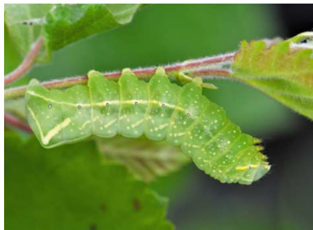
Рис. 28 / Fig. 28. Amphipyra pyramidea

Широко распространенный западно-палеарктический вид. В России встречается от европейской части до Дальнего Востока [Каталог..., 2019]. На сегодняшний день это единственная известная находка в Карелии. В Финляндии обычен.