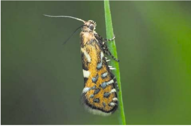
Рис. 19 / Fig. 19. Glyphipterix bergstraesserella