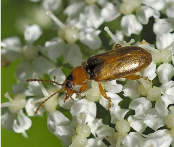
Рис. 13 / Fig. 13. Orsodacne cerasi

Палеарктический вид, распространенный от Европы до Сибири. На европейской части России встречается от таежной до степной зоны [Жесткокрылые..., 2019]. Это первая и пока единственная достоверная находка данного вида и семейства на территории Карелии. В Финляндии ранее считался очень редким, но в настоящее время представлен стабильными популяциями [The 2019 Red..., 2019].