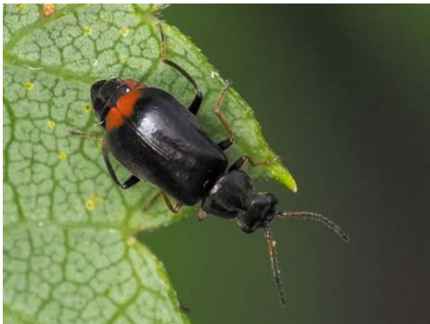
Рис. 7 / Fig. 7. Ebaeus laplandicus

Материал: Kol : окр. Орзегги, дачный участок, 29.07.2023 [ https://www.inaturalist.org/observations/175631176 ].