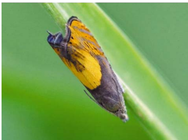
Рис. 26 / Fig. 26. Dichrorampha flavidorsana

Широко распространенный палеарктический вид. В России встречается от европейской части до Амурской области [Каталог..., 2019]. В Карелии на сегодняшний день известен лишь по двум этим находкам. В Финляндии обычен.