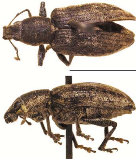
Рис. 16 / Fig. 16. Tanytrecus palliatus . Вид сверху и сбоку (масштаб 5 мм) / Dorsal and lateral view (scale bar 5 mm)

Liparus coronatus (Goeze, 1777) (рис. 17).