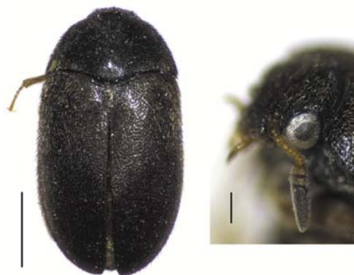
Рис. 6 / Fig. 6. Attagenus unicolor . Вид сверху (масштаб 1 мм) и голова сбоку (масштаб 0,2 мм) / Dorsal view (scale bar 1 mm) and head in lateral view (scale bar 0.2 mm)

Материал: Кол: Петрозаводск, 29.06.2013, 23.06.2021 (А. Хумала).