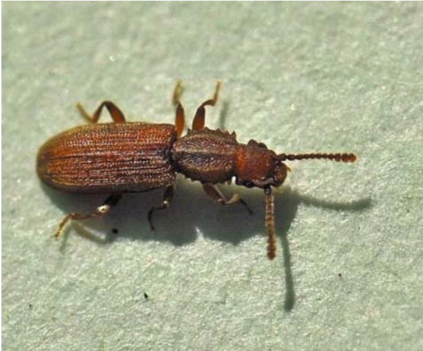
Рис. 10 / Fig. 10. Oryzaephilus surinamensis

Космополитичный вид, широко распространившийся по миру в эпоху географических открытий. Считается чужеродным в ряде европейских стран, однако фактически стал аборигенным в некоторых регионах земного шара [Справочник..., 2019], в частности, в южных регионах России встречается в природных условиях [Жесткокрылые..., 2019]. В Карелии отмечен исключительно в жилищах человека, где вредит пищевым запасам.