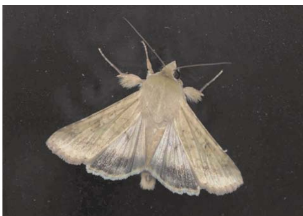
Рис. 27 / Fig. 27. Helicoverpa armigera

Материал: Kol : Петрозаводск, 28.08.2022 [ https://www.inaturalist.org/observations/132698473 , https://www.inaturalist.org/observations/132698471 ].