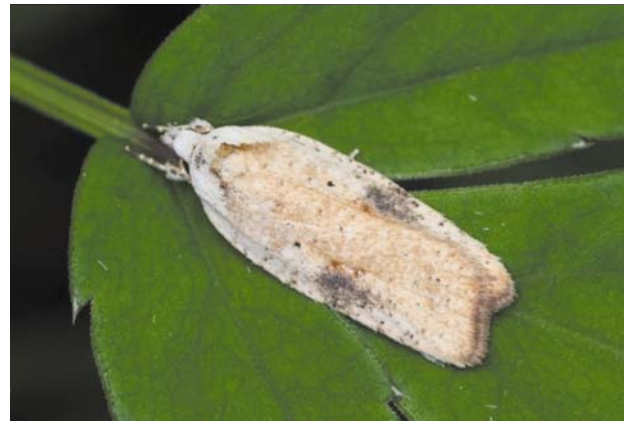
Рис. 21 / Fig. 21. Agonopterix nervosa

Западно-палеарктический вид. В России распространен на европейской части от Европейского южно-таежного до Южно-Уральского региона [Каталог..., 2019]. На сегодняшний день это единственная находка в Карелии. В Финляндии обычен.