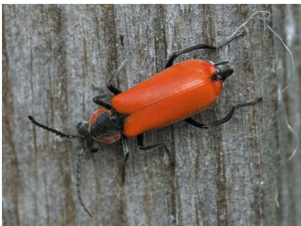
Рис. 8 / Fig. 8. Anthocomus rufus

Материал: Kl : Рускеала, Отраккала, 15.08.2022 [ https://www.inaturalist.org/observations/131055507 ]; Kol : окр. Орзегги, дачный участок, 28.08.2022, 1.10.2023 [ https://www.inaturalist.org/observations/132649461 ]; https://www.inaturalist.org/observations/185815789 ].