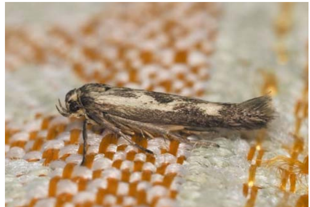
Рис. 22 / Fig. 22. Scythris limbella

Широко распространенный палеарктический вид. В России достоверно отмечен только в европейской части [Каталог..., 2019]. На сегодняшний день это единственная находка в Карелии. В Финляндии вид считается уязвимым и отнесен к категории VU [The 2019 Red..., 2019].