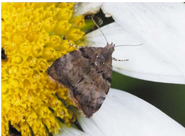
Рис. 23 / Fig. 23. Choreutis pariana

Широко распространенный палеарктический вид. В России встречается от европейской части до Дальнего Востока [Каталог..., 2019]. В Карелии известен по единичным находкам. В Финляндии вид редок, но его популяции стабильны.