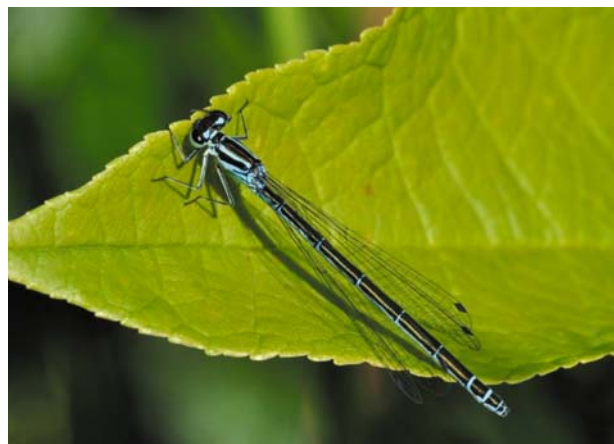
Рис. 1 / Fig. 1. Coenagrion puella

как регион возможного распространения вида, однако без подтверждения конкретными данными [Скворцов, 2010]. В Финляндии вид стал довольно обычным в последнее время, однако, как и в Карелии, находки пока ограничены южными районами [FINBIF..., 2023a].