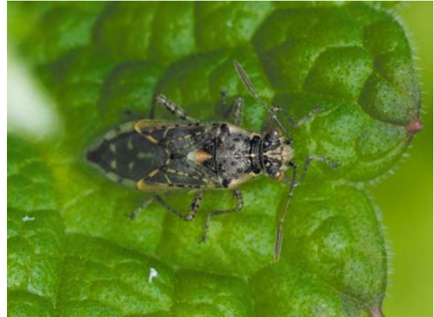
Рис. 4 / Fig. 4. Brachycarenum tigrinus

Материал: Kol : окр. Орзегги, дачный участок, 28.08.2022 [ https://www.inaturalist.org/observations/182668432 ].