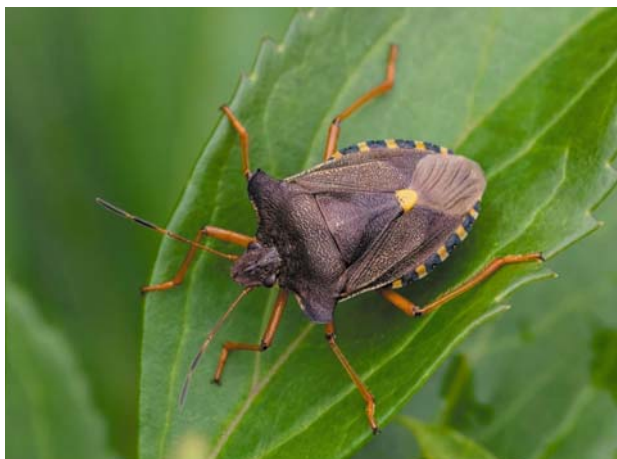
Рис. 5 / Fig. 5. Pentatoma rufipes

www.inaturalist.org/observations/179513511]; 22.08.2023 [https://www.inaturalist.org/observations/180698980]; 31.08.2023 [https://www.inaturalist.org/observations/181056202]; Прионежский р-н, окр. Орзег, дачный участок, 19.06.2021, 28.08.2022 [https://www.inaturalist.org/observations/83698468]; https://www.inaturalist.org/observations/132649437]; Кол: заказник «Кижский», о. Б. Клименецкий, ур. Конда, 14.08.2019 (Полевой); Пиньгуба, 21.07.2019, 28.07.2023 [https://www.inaturalist.org/observations/29304218; https://www.inaturalist.org/observations/176971206]; Спасская Губа, 20.08.2023 [https://www.inaturalist.org/observations/179305511]; Алекка, 9.08.2021 [https://www.inaturalist.org/observations/90524799]; 3.08.2023 [https://www.inaturalist.org/observations/184902227]; КИ: о. Селькямарьянсаари, 2.08.2021 [https://www.inaturalist.org/observations/89796723]; Сортавала, 9.08.2021 [https://www.inaturalist.org/observations/90650521]; о. Мантсинсаари, 26.08.2021 [https://www.inaturalist.org/observations/92568100].