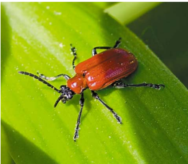
Рис. 14 / Fig. 14. Lilioceris lili

Материал: Kon : Пиньгуба, дачный участок, 9.06.2021, 10.06.2023 (А. Полевой); Kol : Петрозаводск, 19.08.2023 [https://www.inaturalist.org/observations/179177989]; Kl : Валаам, 9.08.2023 [https://www.inaturalist.org/observations/178802033].