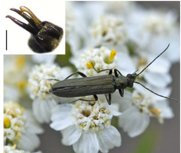
Рис. 12 / Fig. 12. Oedemera subrobusta . Вид сверху и гениталии самца (масштаб 0,2 мм) / Dorsal view and male genitalia (scale bar 0.2 mm)

Материал: Коп : заказник «Кижский»: о. М. Леликовский, 28.07.2018; о. Букольников, 30.07.2018; о. Радколье, 30.07.2018; Грызноволок, 2.07.2019; о. Павлухин, 2.07.2019; о. Орож-Яма, 5.07.2019, 17.08.2019; Сенная Губа, 16.08.2019 (А. Полевой, А. Хумала).