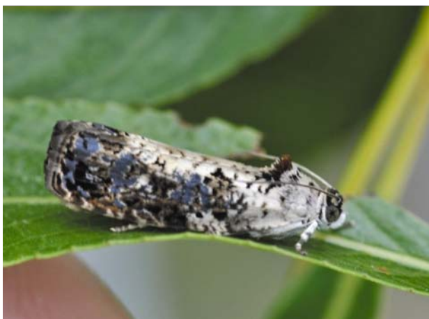
Рис. 24 / Fig. 24. Hedya salicella

Широко распространенный палеарктический вид. В России встречается от европейской части до Дальнего Востока [Каталог..., 2019]. На сегодняшний день это единственная находка в Карелии. В Финляндии обычен.