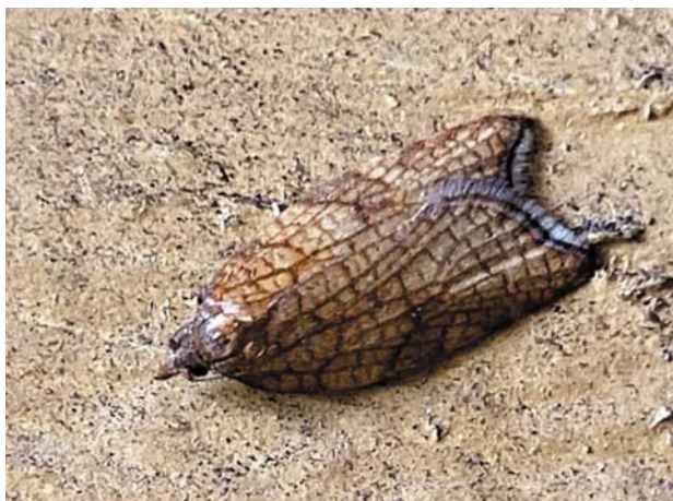
Рис. 25 / Fig. 25. Acleris rhombana

Широко распространенный западно-палеарктический вид. В России встречается на европейской части [Каталог..., 2019]. На сегодняшний день это единственное известное местонахождение вида в Карелии. В Финляндии обычен.