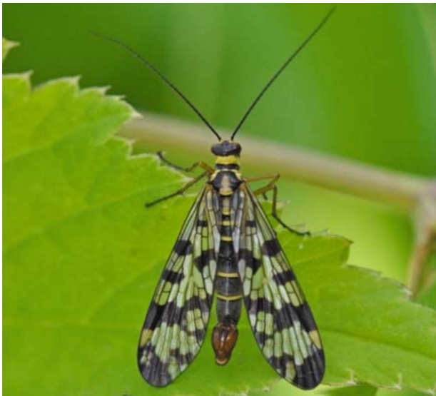
Рис. 29 / Fig. 29. Panorpa vulgaris

observations/18968638]; Кончезеро, 4.06.2013 [https://www.inaturalist.org/observations/18983122]; Пиньгуба, 12.06.2021 [https://www.inaturalist.org/observations/83243704]; Kton : Мыс Черный, 8.07.2019 [https://www.inaturalist.org/observations/36945310]; Мыс Кладовец, 30.06.2018 [https://www.inaturalist.org/observations/20705731]; Kl : Маткаселькя, 13.07.2023 [https://www.inaturalist.org/observations/174493658]; Kol : Гижино, 5.07.2008 [https://www.inaturalist.org/observations/18586863]; Лососинное, 29.05.2013 [https://www.inaturalist.org/observations/19269619]; Деревянка, 23.07.2023 [https://www.inaturalist.org/observations/174518026]; Петрозаводск, 19.06.2020, 23.06.2020, 10.07.2020, 24.06.2021 [https://www.inaturalist.org/observations/50196264, https://www.inaturalist.org/observations/50779371, https://www.inaturalist.org/observations/52699605, https://www.inaturalist.org/observations/84679080].