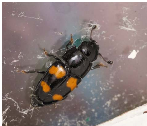
Рис. 9 / Fig. 9. Glischrochilus grandis

Материал: Kol : Кондопога, Нигозеро, 17.08.2011, 29.05.2012 [ https://www.inaturalist.org/observations/143174989 , https://www.inaturalist.org/observations/39123058 ]; Пиньгуба, дачный участок, 6.06.2021 [ https://www.inaturalist.org/observations/82198072 ], 3.06.2018, 7.08–2.10.2022, 16–19.08.2023 (А. Полевой); Kol : окр. Орзегги, дачный участок, 6.08.2023 [ https://www.inaturalist.org/observations/177025313 ].