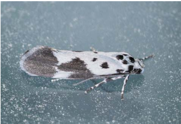
Рис. 20 / Fig. 20. Ethmia quadrillella

Широко распространенный палеарктический вид. В России встречается от европейской части до Западной Сибири [Каталог..., 2019]. На сегодняшний день это единственная находка в Карелии. В Финляндии вид редок, но его популяции стабильны. В Швеции вид внесен в Красную книгу с категорией NT [SLU..., 2020], в Норвегии у него категория VU [Norsk..., 2021].