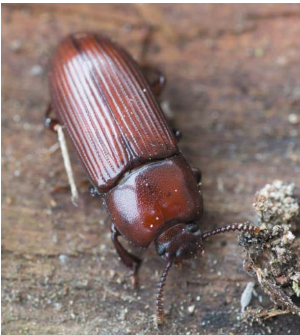
Рис. 11 / Fig. 11. Uloma culinaris

Материал: Коп : Кондопога, Нигозеро, 17.08.2016 (А. Кайнелайнен).