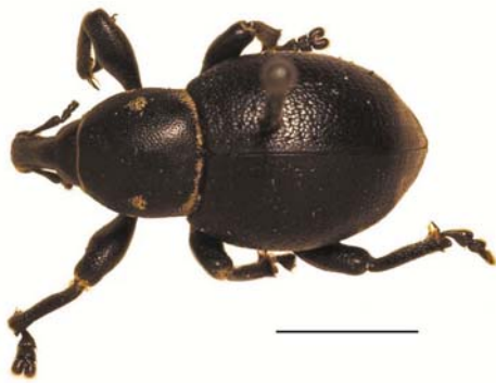
Рис. 17 / Fig. 17. Liparus coronatus . Вид сверху (масштаб 5 мм) / Dorsal view (scale bar 5 mm)

Широко распространен в Южной и Центральной Европе, доходя на север до юга Швеции [Alonso-Zarazaga et al., 2023]. В европейской части России заходит на север до Башкирии и Самарской области [GBIF..., 2024]. В Карелии известен по единственной находке.